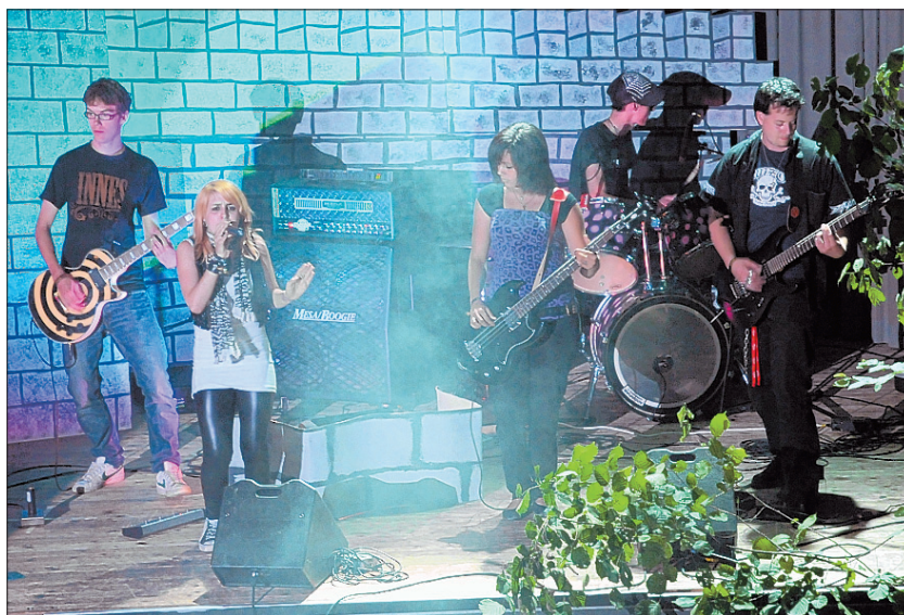
ROCKIGE KLÄNGE Nicht nur klassische Klänge wurden gespielt, am Kulturtag trat auch eine Rockband auf.

Die Jahresrechnung des Blumenhauses zeigt folgende Ergebnisse: Der Aufwand lag bei 11,4 Mio., der Aufwandüberschuss bei 6,5 Mio., das Eigenkapital umfasst 4,2 Mio., und das Fondskapital bezifferte sich mit 1,4 Mio. Franken. Der Personalaufwand im Betrag von 9,4 Mio. ist an der Gesamtbilanz seit 1990 gleichbleibend mit 82 Prozent beteiligt. Der Aufwand für Leitung und Verwaltung macht 6 Prozent der Rechnung aus. (GKU)